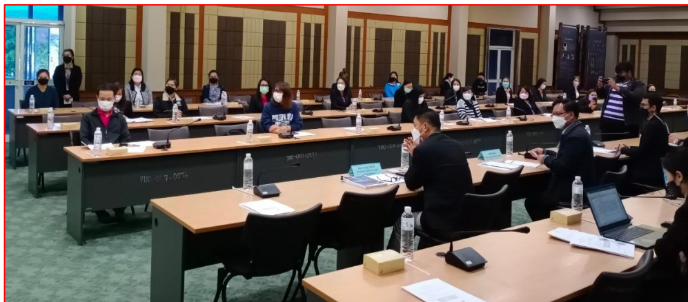
ประธานได้กำหนดแนวทาง และมอบหมายให้คณะทำงานฯ และผู้ประสานงานของคณะทำงานฯ ทำหน้าที่ ขับเคลื่อนการประเมิน ITA ของจังหวัดเชียงราย ในปีงบประมาณพ.ศ. ๒๕๖๕